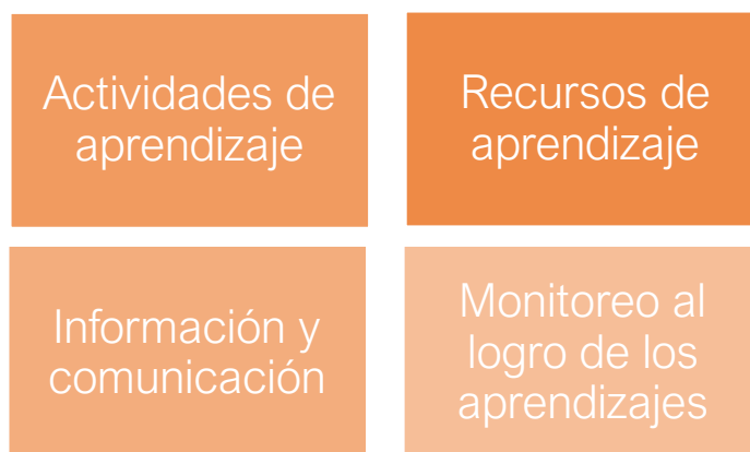
Figura 1.- Dimensiones TIC (Area & Adell, 2009)

Dimensiones para la integración de tecnologías de aprendizaje